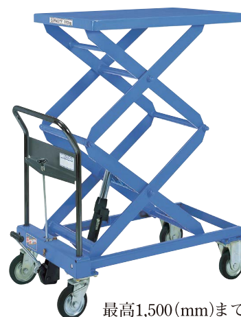
最高1,500(mm)まで 高揚程実現 TL-WH300-15 急降下防止バルブ付