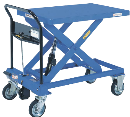
TL-H500-9 急降下防止バルブ付