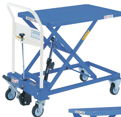
TL-H250-8 急降下防止バルブ付