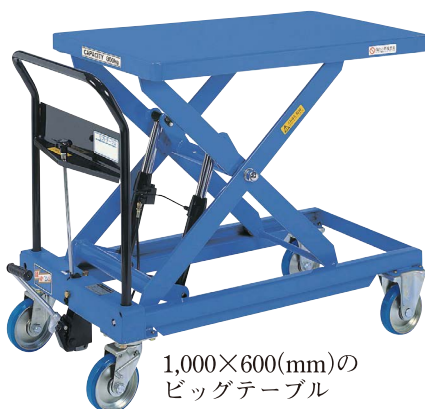
1,000×600(mm)の ビッグテーブル TL-H800-10 急降下防止バルブ付