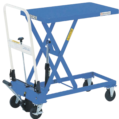
TL-H150-7 ハンドル折りたたみ式